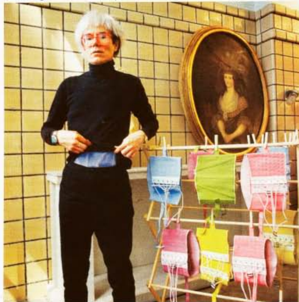
1986 : à la Factory, son atelier new-yorkais, Andy Warhol avec ses corsets qu'il est obligé de porter depuis qu'on a tenté de l'assassiner.

D'abord mettre en confiance. Puis se faire oublier. Sous la tête d'un cheval, par exemple. C'est sa recette : trouver un angle insolite et saisir sur le vif les expressions les plus spontanées des grands de ce monde. A l'image de Brassai, son maître, auprès de qui il a passé un an en France, Jonathan Becker se dit obsédé par la vérité des êtres. D'ordinaire, les têtes couronnées ne sont pas faciles à prendre : « Moins naturelles que les artistes qui ont aussi le sens du visuel. » Le photographe a comptabilisé 900 reportages pour « Vanity Fair ». Avec Annie Leibovitz, Jonathan Becker s'inscrit dans la lignée de ces stars qui ont fait la notoriété du magazine américain.