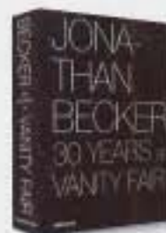
« Jonathan Becker, 30 years at Vanity Fair » vient de sortir aux éditions Assouline. www.assouline.com

Je vois la vie comme une immense scène de théâtre. Une petite pointe de narcissisme est très utile et rend les choses infiniment plus attrayantes. J'aime beaucoup photographier Jocelyn Wildenstein ou Bernard-Henri Lévy. Lui et Arielle savent intuitivement se mettre en scène, ce sont à leur façon de grands acteurs de théâtre. BHL, que j'adore, connaît parfaitement ce que veulent les magazines. Il sait exactement ce qu'on attend de lui, c'est quelqu'un d'unique. Cela dit, j'adorerais faire de nouveaux clichés de tous les gens que j'ai déjà photographiés. En 1991, lorsque je suis retourné voir le Dr Jack Kevorkian, l'ange de la mort, comme on le surnommait, car il était connu pour sa pratique de l'aide au suicide dans les cas médicaux graves, il a accepté de me montrer ses peintures. Il m'a dit qu'il pensait sincèrement que ce qu'il faisait était la chose à faire. Moi, je suis persuadé qu'il était nécrophile.