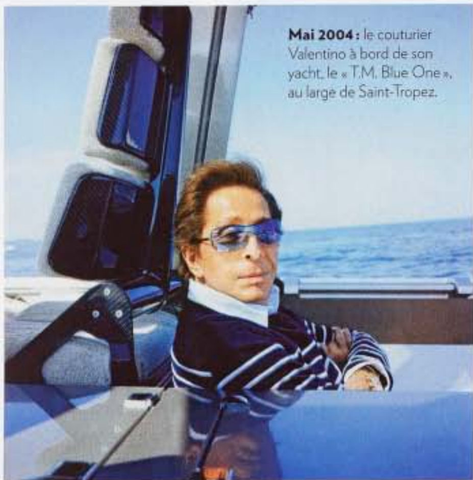
Mai 2004 : le couturier Valentino à bord de son yacht, le « T.M. Blue One », au large de Saint-Tropez.