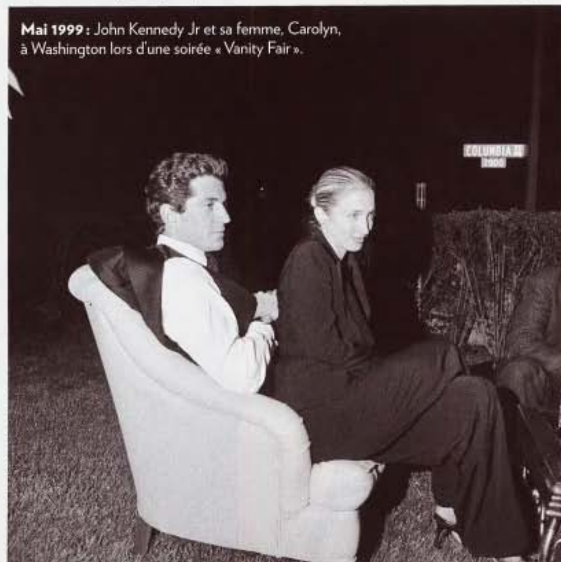
Mai 1999 : John Kennedy Jr et sa femme, Carolyn, à Washington lors d'une soirée « Vanity Fair ».

m'amuse. Moi, j'utilise de la pellicule pour 90% de mes clichés et je me sers de mon bon vieux Rolleiflex. Je ne comprends rien à ces nouveaux appareils photo, il y a trop de boutons! Je préfère passer du temps à observer mon sujet et son environnement que de rester les yeux fixés sur mon ordinateur à vérifier toutes les cinq minutes si mes batteries sont encore chargées. Il suffit d'une seconde pour faire une grande photo. Du moment que j'ai un