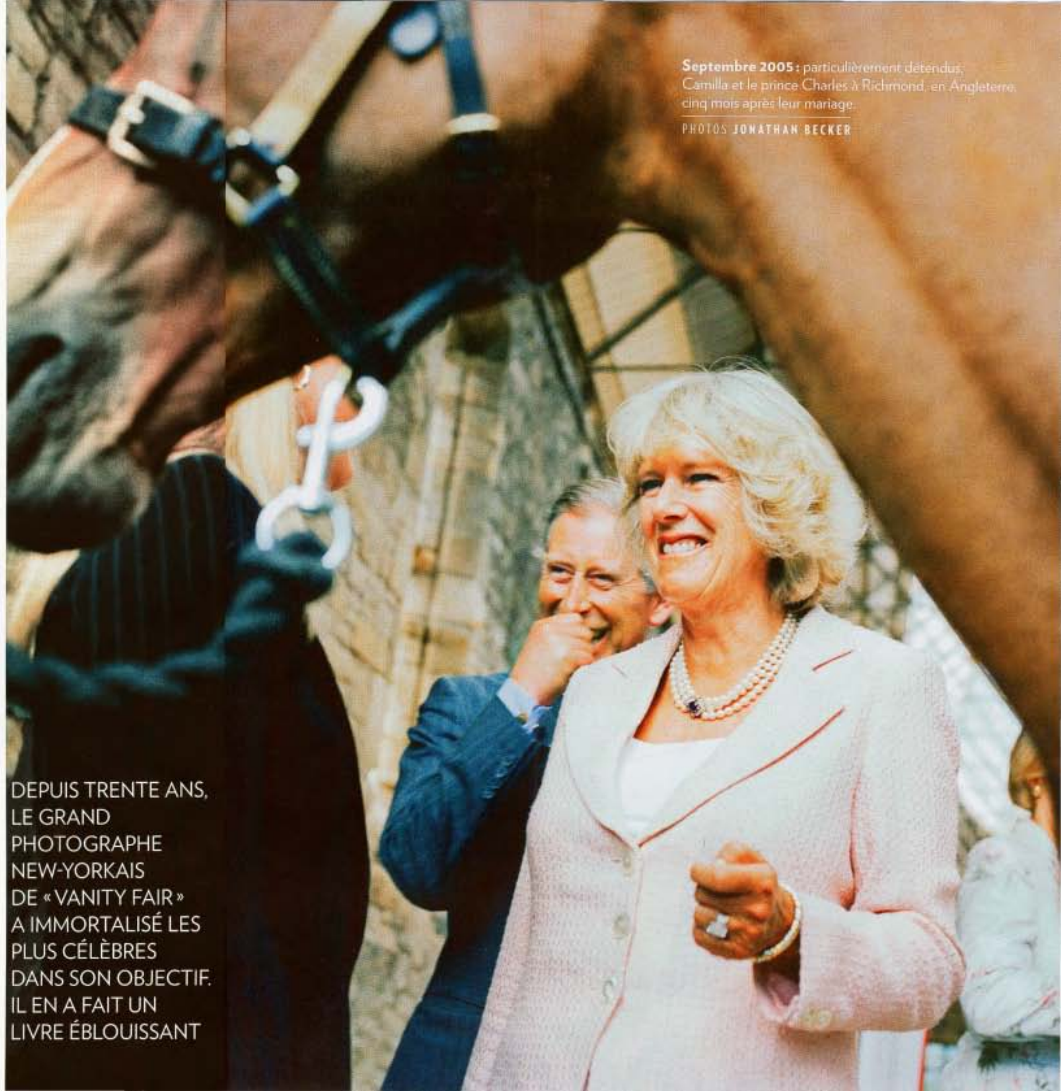
Septembre 2005 : particulièrement détendus, Camilla et le prince Charles à Richmond, en Angleterre, cinq mois après leur mariage.