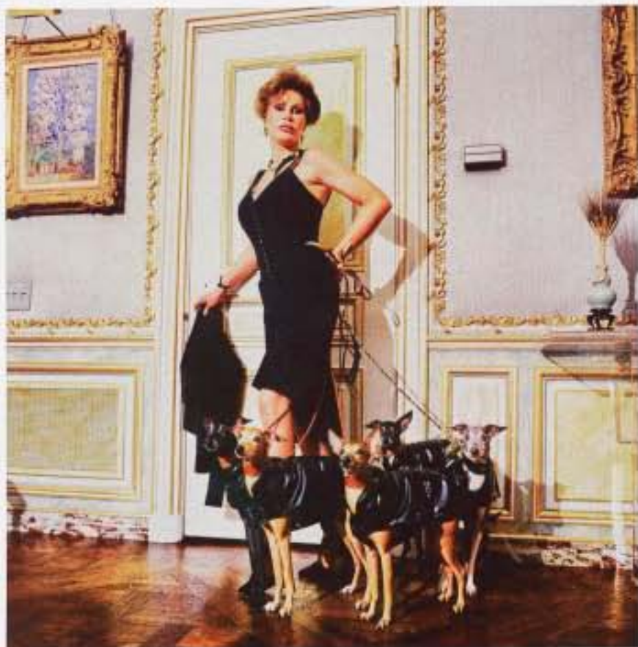
1998 : Jocelyn Wildenstein, l'ex-épouse du milliardaire Alec Wildenstein. La femme-chat, chez elle, à New York, s'apprête à sortir ses chiens, vêtus comme elle en Chanel.